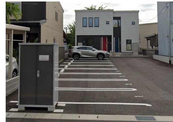
※現況と相違ある場合は現況を優先します。